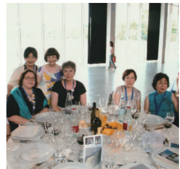
国際ゾンタ第61回 国際大会(イタリア・トリノ)にて