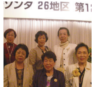
国際ゾンタ 26地区 第12回 地区大会にて