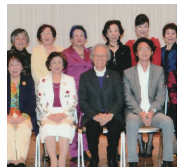
ハートフルパーティ2013 「菅原洋一 ソウルフルライフコンサート」