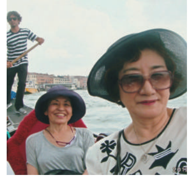
国際ゾンタ第61回 国際大会(イタリア・トリノ)にて