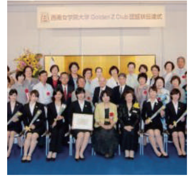
西南女学院大学 Golden Zクラブ認証状伝達式